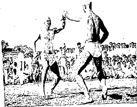
Fig. 3 Vajramsti Wrestling : Beginning